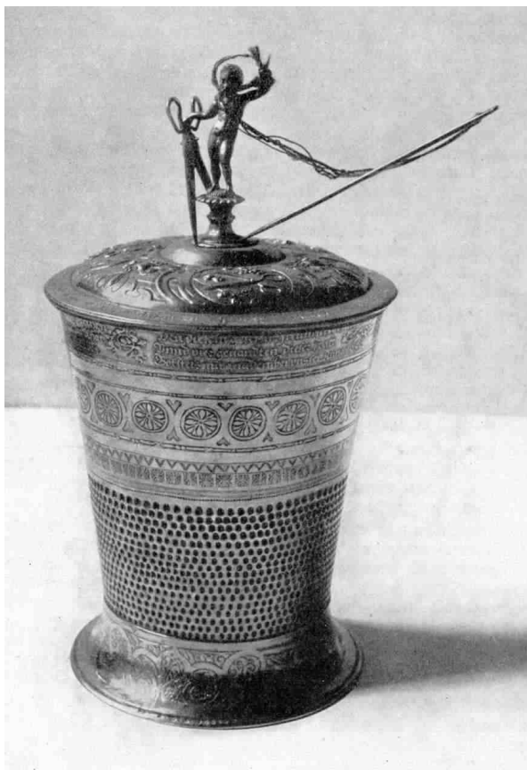
Trinkbecher einer Schneiderinnung Goldschmiedearbeit von 1586

1677 waren einem in die Stadt gekommenen Posamentierergesellen 7 Groschen angeboten worden, die hiesigen Gesellen erhielten aber einen halben Groschen mehr. Da sie Lohndrückerei befürchteten, entspann sich daraus ein kleiner Aufstand. Die Meister wandten sich an den Rat und beide hielten es für richtig, "Solchen frevel zu bestrafen". Die aufgebrummenen 2 Tage Gefängnis verfehlten indes ihre Wirkung, denn wenig später zeigten die Viermeister dem Rat an, dass 15 Gesellen "einen Aufstandt gemacht, nicht arbeiten wolten, sondern beisammen lägen und söffen". Auch hier reagierte der Rat auf Drängen der Zunft mit Gefängnis und Geldstrafen.