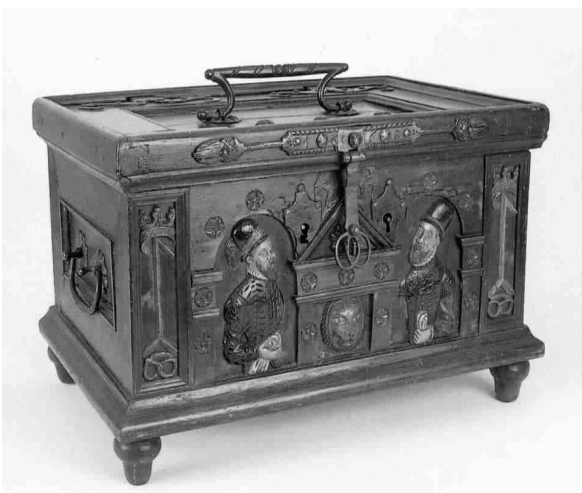
Lade der Bäckerzunft zu Chemnitz ca. 1586

Dieses alte Handwerk legte viel Wert auf Tradition, auf Ehrbarkeit und hatte auch seine Überlieferungen und kleinen Geheimnisse, die zu Teil noch aus vorchristlicher Zeit stammen. Diese werden von Generation zu